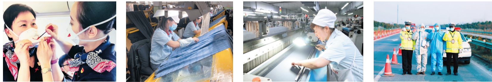
坚守者的微笑 无瑕 专注品质 抗疫守护者