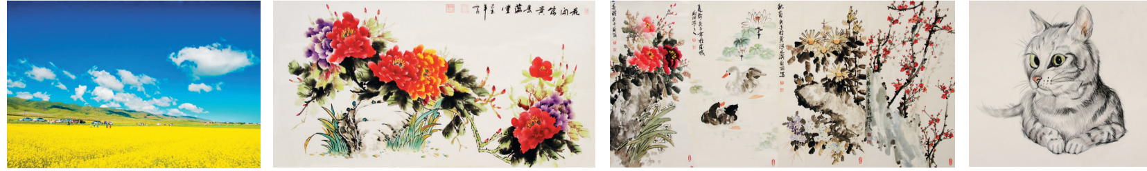
百里花海 张黛娥摄影 花开富贵春满堂 郭效儒作品 牡丹、荷花、秋菊、梅花 姜蔚丽作品 招财猫 王亚琴作品