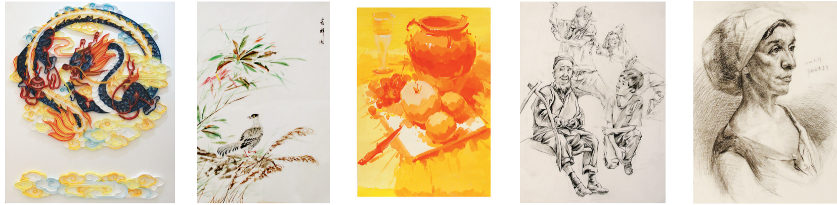
衍纸画龙战于疫 郭婧作品 吉祥图 胡周强作品 彩果 王洋作品 疫情下的生活 王世姣作品 人物头像 杨雅舒作品