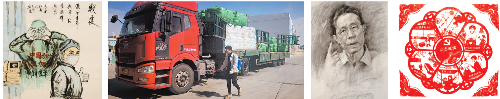
战疫 张立峰作品 严防严控 马恩堂摄影 钟南山 彭宝乐作品 剪纸《众志成城》 邓生凤作品