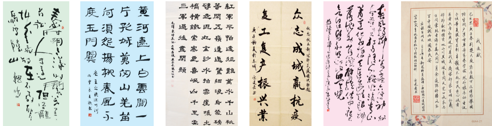
出赛 魏鸣作品 凉州词 王毅作品 中堂 张乃江作品 众志成城、复工复产 宋建红作品 毛泽东(送瘟神)其二 李增君作品 战疫赋 宋建红作品